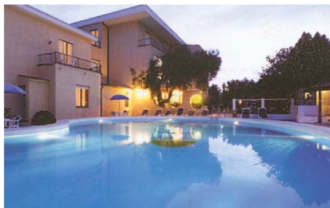
Hotel America – Marina di Camerota

L'iscrizione s'intende perfezionata solo al versamento della quota completa.